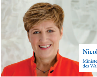
Nicole Razavi Mdl

Ministerin und Landtagsabgeordnete des Wahlkreises Geislingen